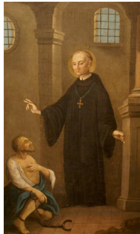
OBRAZ ŚW. LEONARDA Z KOŚCIÓŁA W LUBINIU

AD MAJORAM DEI GLORIAM (NA WIĘKSZĄ CHWAŁĘ BOGU)