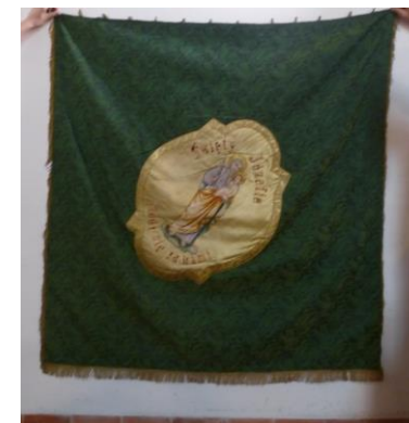
SZTANDAR BRACHTWA Z 1914 ROKU (OBECNIE NIE UŻYWANY, ZE ŚLADAMI PRZESZYCIA POŁACI HAFTÓW ŚW. JÓZEFA I ŚW. LEONARDA NA NOWE PODŁOŻE)